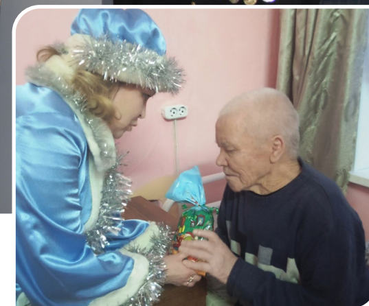
Волонтер фонда «Старость в радость» вручает новогодний подарок подопечному.