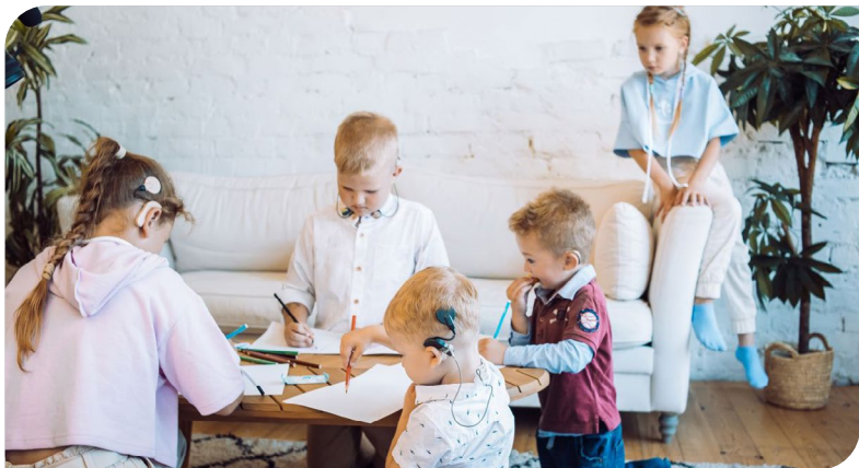
Фотопикник для подопечных АНО «Я тебя слышу».