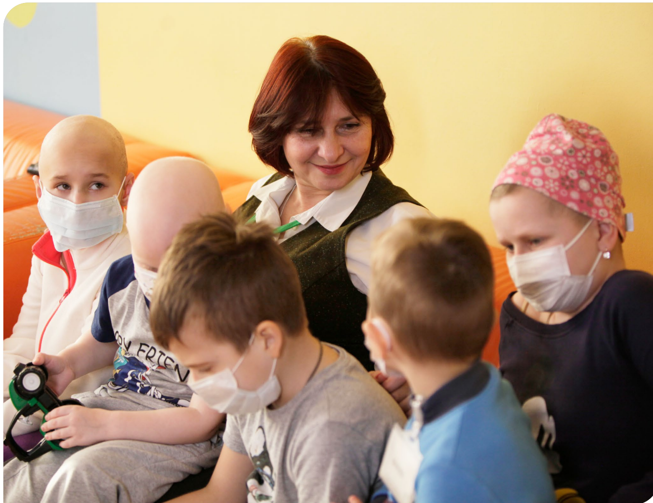
Директор фонда «Настенька» с подопечными в одной из больниц Москвы.