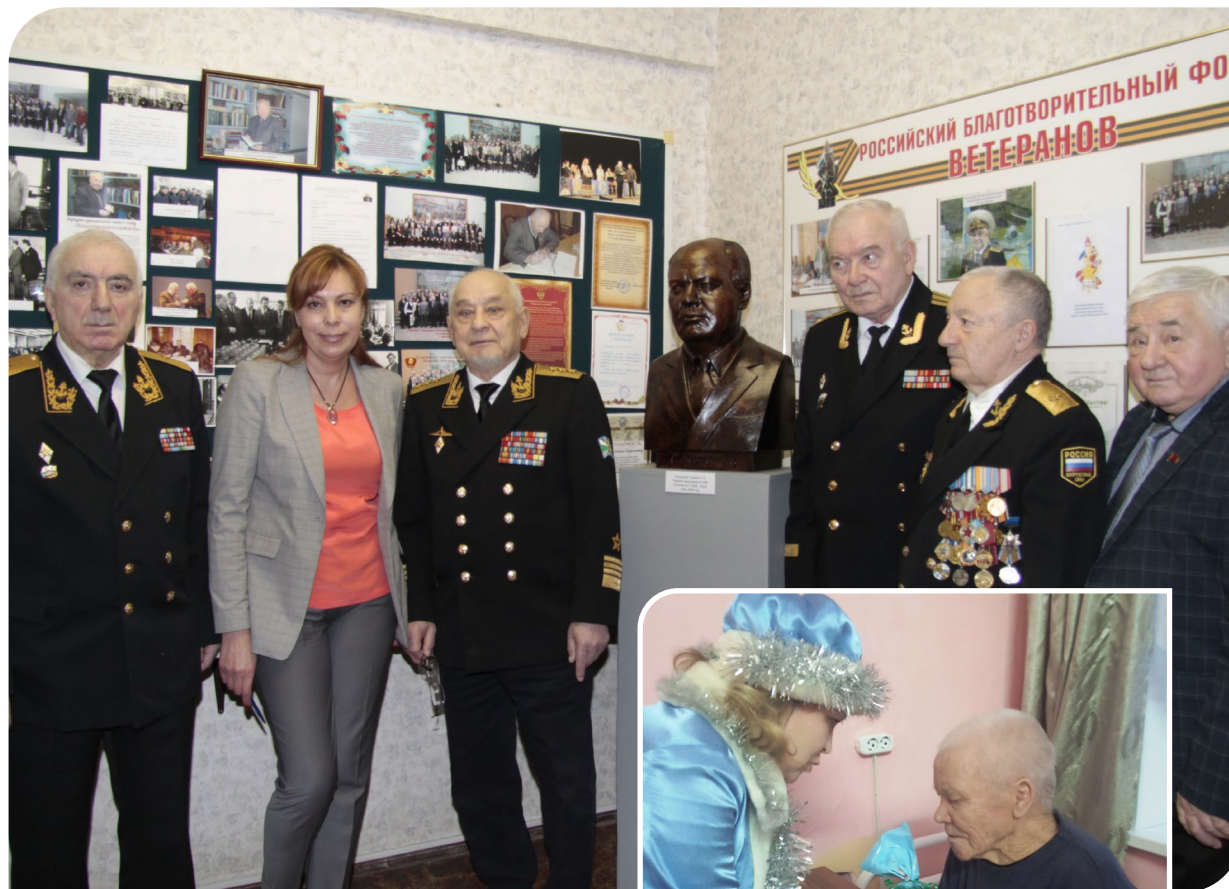
Ветераны в музее Российского фонда ветеранов.

В поддержку старшего поколения в декабре в банке прошла традиционная акция по сбору новогодних подарков для одиноких пожилых людей, реализуемая совместная с фондом «Старость в радость» . На собранные средства фонд закупил подарки и передал их в дома-интернаты для престарелых и инвалидов Воронежской, Смоленской, Курганской и Тверской областях.