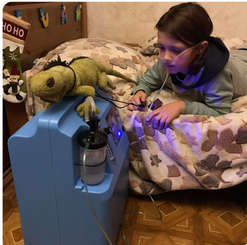
Кислородный концентратор жизненно необходим для большинства подопечных фонда «Во имя жизни».

Благодаря поддержке банка благотворительный фонд помощи детям с тяжелыми заболеваниями печени «Жизнь как чудо» продолжает реализацию программы «Школа по заболеваниям печени» в части обучения медицинского персонала новым методикам диагностики. На полученное пожертвование фонд организовал обучающие курсы для врачей из регионов России с привлечением ведущих специалистов в области лечения заболеваний печени и трансплантологии, что позволит повысить качество ранней диагностики заболеваний печени у детей и эффективность неотложной и пролонгированной терапии.