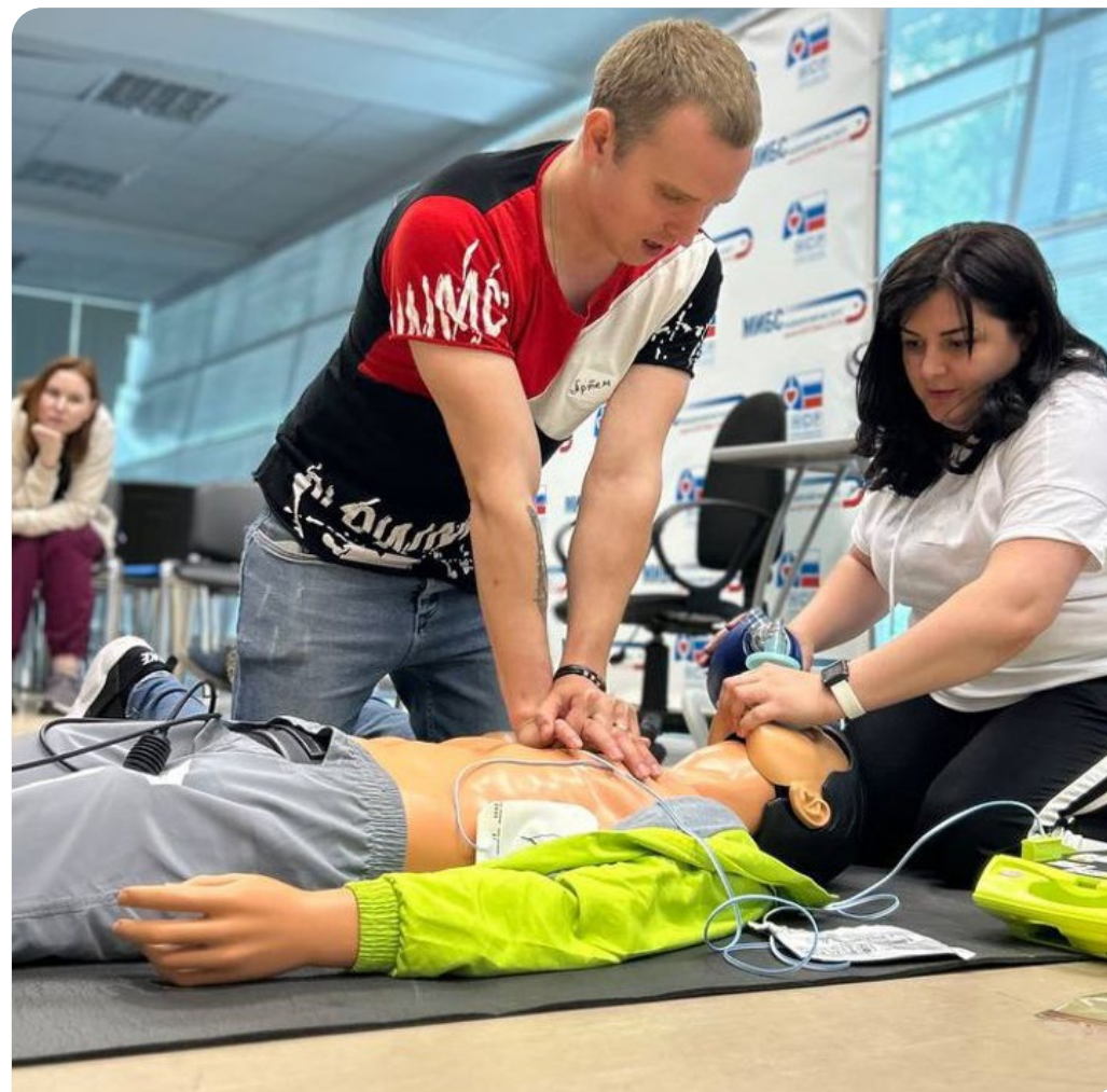
Фантом-система для тренировки сердечно-легочной реанимации в МИБС (Санкт-Петербург).

В сентябре в банке состоялся День донора , в котором приняли участие более 40 сотрудников. 38 из них стали донорами. Было собрано 17 литров крови, которая поступила в НМИЦ детской гематологии, онкологии и иммунологии имени Дмитрия Рогачева. Кроме того, сотрудники не ограничились сдачей крови – они сделали личные пожертвования в адрес благотворительного фонда «Подари жизнь», партнера банка и организатора этой акции.